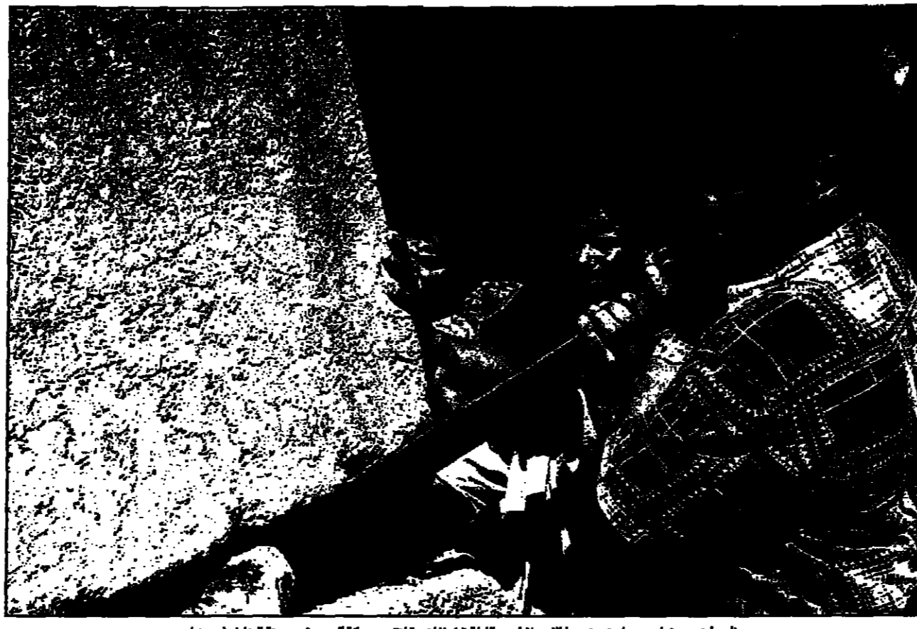
فلسطينيون يتولون حواجز وضعت الاسرائيليون الليلة قبل الماضية لتقييد حركة العرب في مدينة الخليل (دويش)